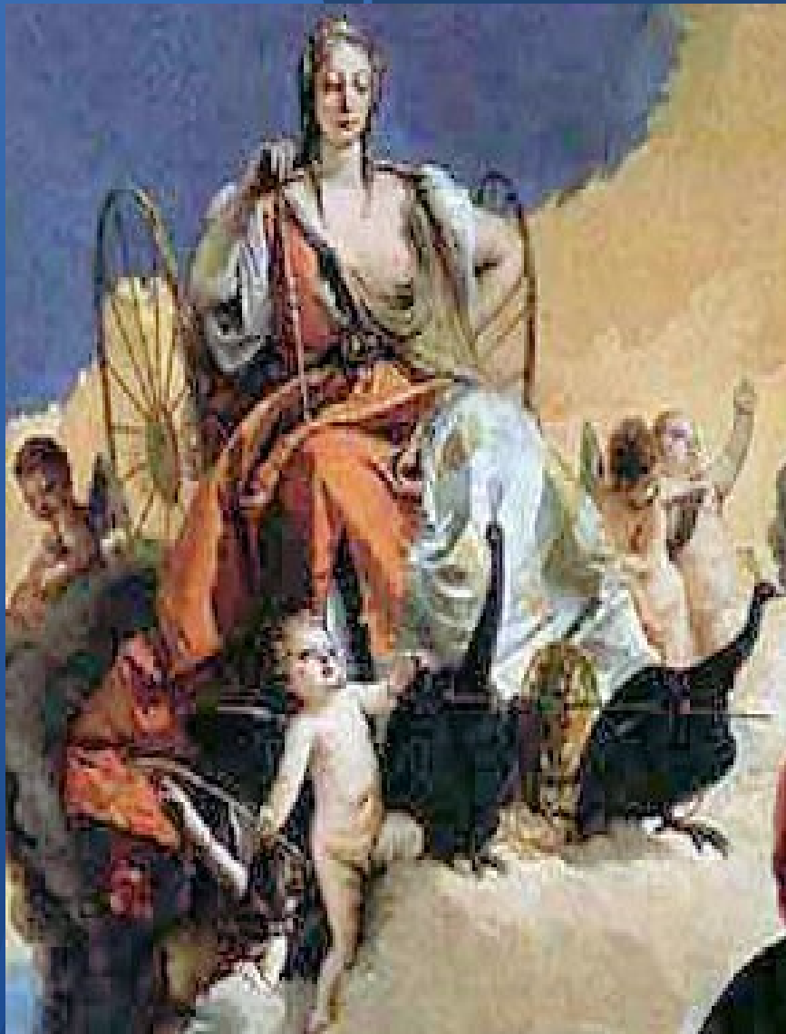
D'autres représentations de Junon