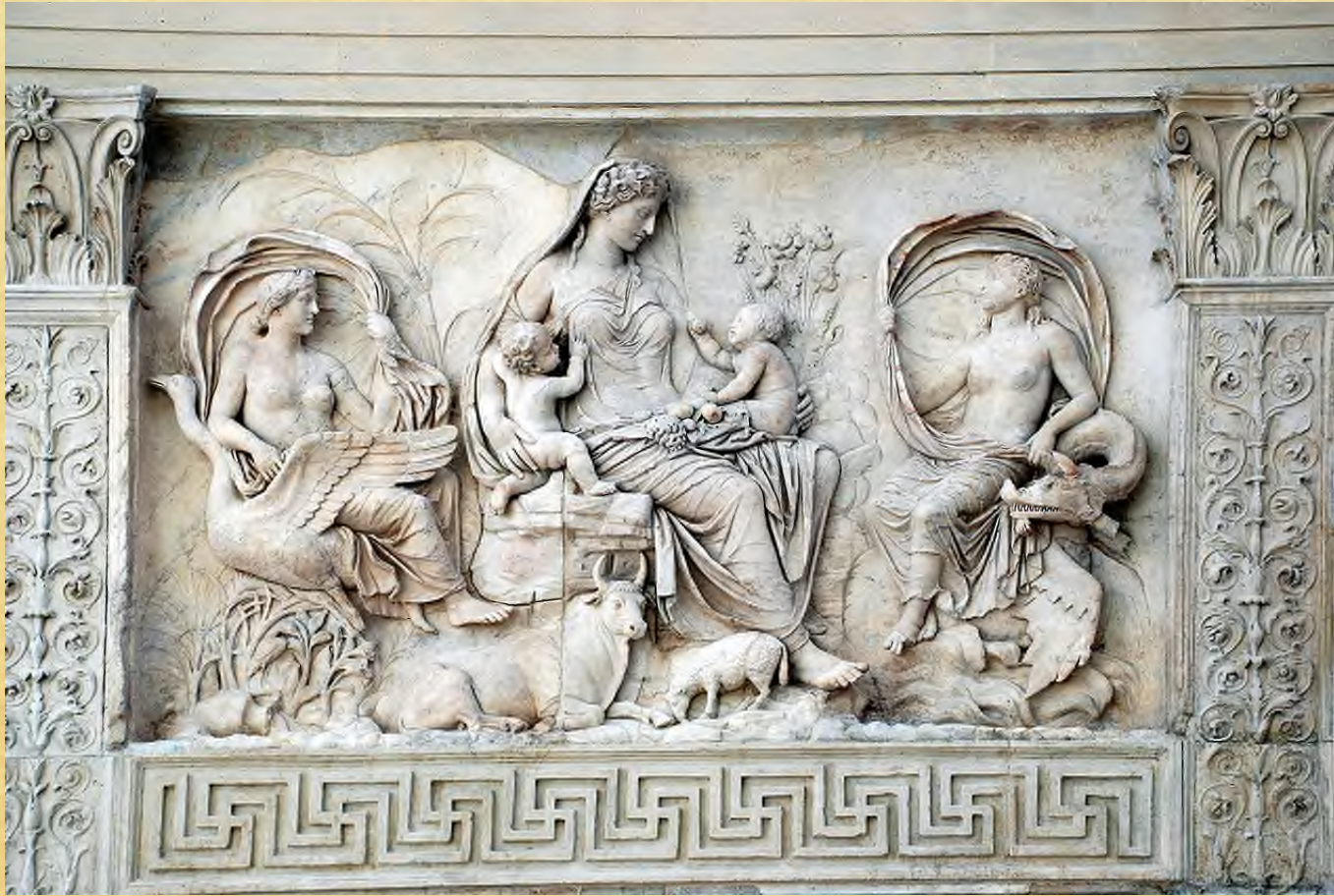
Bas relief de l'Ara Pacis Augustae (Rome), Artiste inconnu, entre 13 et 9 avant JC