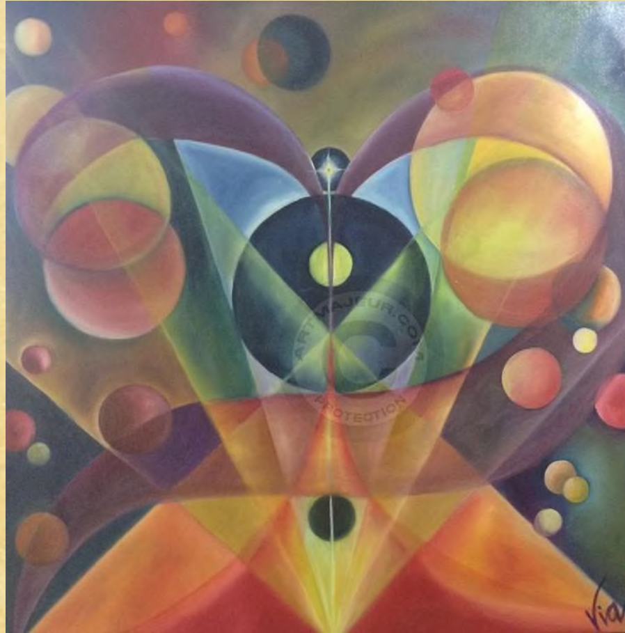
Diva Gaïa, 2015, peinture moderne